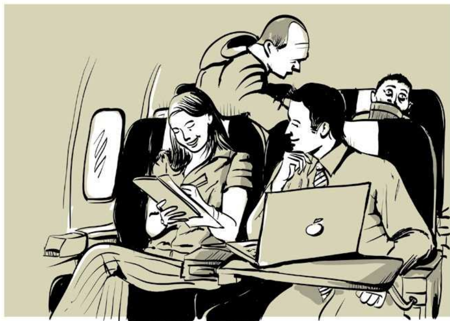
CI SEDEMMO DALLA PARTE DELL'INDIFFERENZA, VISTO CHE I POSTI DELLA RAGIONE O DEL TORTO NON LI DISTINGUEVAMO PIÙ.

Direttamente discendente dal luogo comune che vede l'immigrato come un peso economico e come un soggetto potenzialmente pericoloso per la comunità, l'approccio umanitario di queste associazioni si pone non troppo distante dalle posizioni della destra più razzista. Sfoggiare schiere di migranti armati di rastrelli e attrezzi di pulizia, sul piano mediatico, ha la funzione di trasformare un luogo comune in un altro. Da soggetto pericoloso e sgradevole al decoro cittadino che bivacca