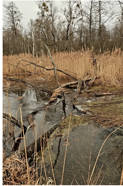
Figura 5: Quando le temperature diventano meno rigide, il fiume Narewka si scongela, pregiudicando il proseguo del percorso delle persone in movimento.