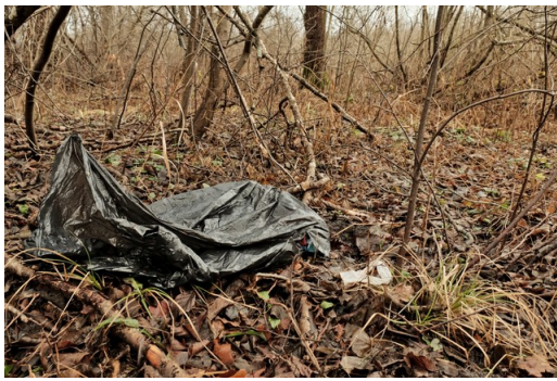
Figura 4: Vestiti abbandonati all'interno della foresta dalle persone in movimento