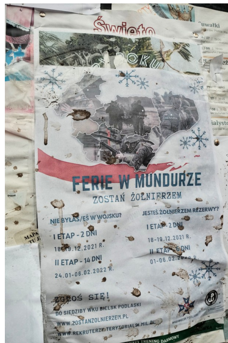
Figura 3: Locandina trovata in una bacheca di Białowieża, città nella zona rossa, che promuove delle vacanze estive assieme agli Obrony Terytorialnej usando la retorica del campo avventura nei boschi del Białowiecki Park.

Se da un lato la strumentalizzazione politica della situazione è evidente, dall'altra la capitalizzazione economica della situazione è un'occasione ghiotta. Nell'ultimo anno, l'UE ha portato i finanziamenti per la gestione delle politiche frontaliere di Polonia, Lituania e Lettonia a 226mln di €, triplicando le cifre del 2020. Questi soldi vengono investiti sulla militarizzazione del territorio, l'approvvigionamento di armi, ammodernamento dei centri di reclusione e la creazione di nuovi. Attualmente in Polonia sono presenti 15 centri di detenzione, la maggior parte dei quali era stata costruita per le persone provenienti dalla Cecenia durante la guerra civile con la Russia; in seguito non erano stati più utilizzati non essendoci più stati grandi flussi di persone in movimento verso l'Europa che passassero dal confine polacco. Diverse strutture inutilizzate nei pressi del confine sono diventate prigioni per le persone che attraversano il confine, che vi vengono trasportate o in attesa del rimpatrio coatto in Bielorussia o per la procedura di richiesta d'asilo. Nell'ultimo periodo infatti, l'UE ha introdotto delle deroghe che permettono agli stati coinvolti di iniziare la procedura di richiesta d'asilo direttamente alla frontiera estendendo il periodo per presentare la richiesta da 10 giorni a 4 settimane, fornendo