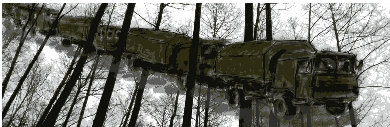
Figura 2: L'ultima foresta primaria d'Europa è di fatto invasa e monopolizzata dalle forze militari polacche, che di fatto sono le uniche persone che non vi abitano o lavorano che possono accedervi.

La composizione della popolazione nella regione di Białystok è altresì molto interessante. Nonostante sia storicamente una delle zone della Polonia con la maggiore presenza nazionalista, la vicinanza alla Bielorussia ha da sempre implicato l'esistenza di una minoranza ortodossa fortemente anti-statale che spesso ha pagato in prima persona la discriminazione e la repressione da parte dello stato. Anche la componente cattolica è molto variegata e non sempre legata alla corrente conservatrice. In generale, la popolazione dei villaggi adiacenti al confine si dimostra solidale con le persone in transito, attivandosi in prima persona quando coinvolta, nonostante la forte propaganda dissuasiva dello stato. Diversi contatti sottolineano come questa