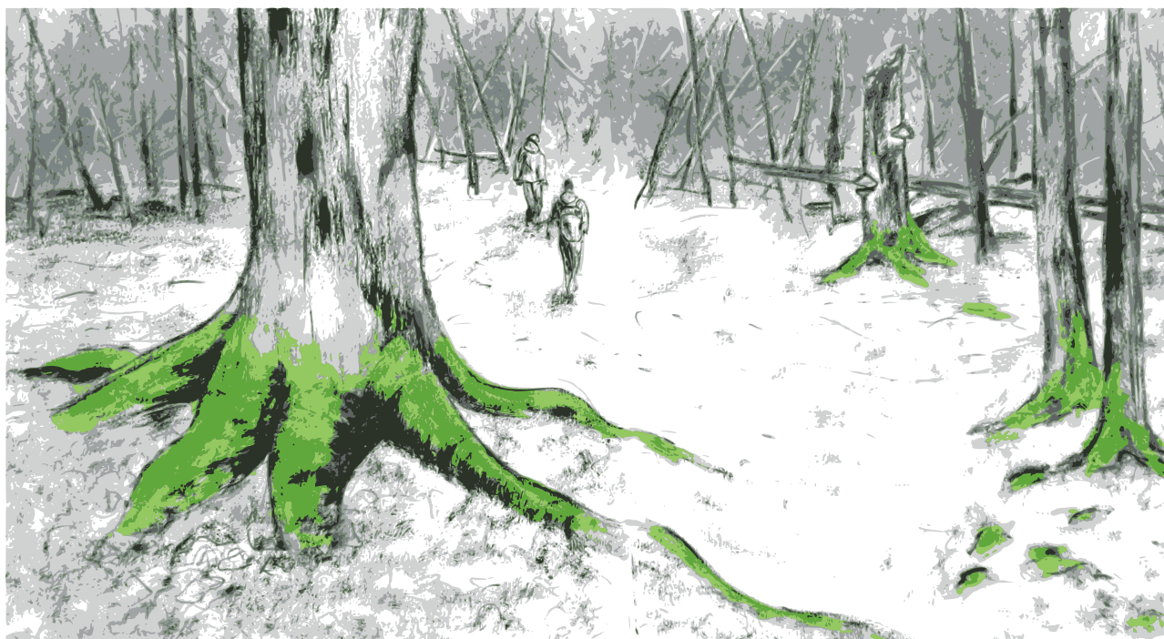
Figura 1: La foresta primaria di Bialowieza, ultima rimasta in Europa.

Un gioco sulla pelle delle persone in movimento a cui non partecipa solo il regime bielorusso, ma che vede come parte attiva sia la Russia di Putin che gli stati dell'UE sopracitati. Se la prima utilizza questa situazione per portare una fantomatica solidarietà a Lukashenka sotto forma di una sempre maggiore quantità di militari a ridosso dell'Europa e dell'Ucraina, obiettivo da anni sotto i riflettori di Putin, i secondi traggono vantaggi economici e politici dalla creazione ad hoc di quella che viene venduta come un'emergenza umanitaria.