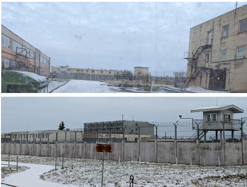
Figura 7: Foto delle ex-carceri sovietiche ri-adibite a centri di detenzione per le persone in transito senza documenti, che vi restano un anno prima di essere espulse dalla Lituania.