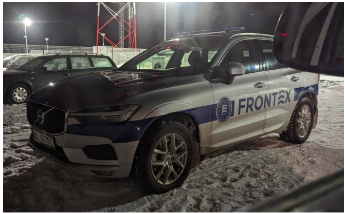
Figura 6: Macchina di FRONTEX in territorio lituano. È curioso notare come arrivi direttamente dalla sede principale di FRONTEX, come testimonia la targa 'WL' di Warszawa.

Tra le due situazioni, quella di cui ci han parlato più approfonditamente è quella lituana. Alcuni compagni infatti, periodicamente cercano di andare a confrontarsi con le poche persone attive in loco. Nonostante il confine sia più esteso della parte polacca l'afflusso è inferiore rispetto a quello polacco, presumibilmente per la distanza della Lituania da altri paesi europei, ma la condizione una volta eluso il respingimento coatto è particolarmente grave.